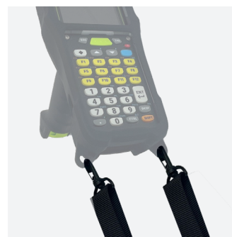
BANDOULIÈRE BASIQUE 2 points d'accroche Ref. 001093