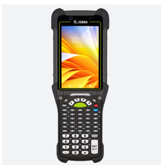
PROTÈGE ÉCRAN Ref. 036325