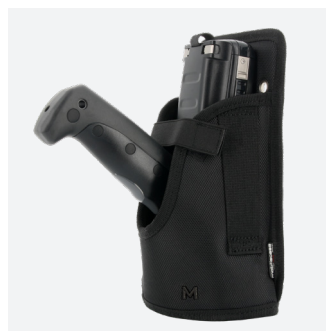
HOLSTER Ref. 031004