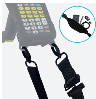
BANDOULIÈRE + POCHE EXTENSIBLE Ref. 001092