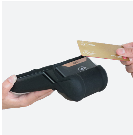
Compatible la fonctionnalité de paiement sans contact