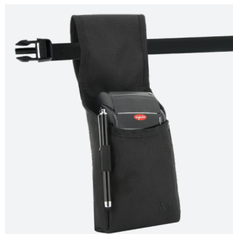
HOLSTERS Ref. 031022