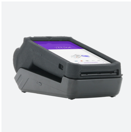
Compatible avec le socle de charge