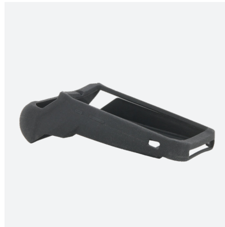
Shore 70 - Silicone dur Plus rigide, plus résistant à l'usure