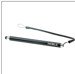
001054 - Pack de 10 Stylet capacitif et cordon spiralé