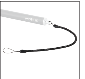
001032 - Pack de 10 Cordon spiralé