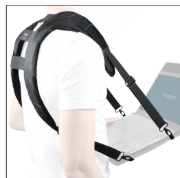
001026 Harnais ergonomique 4 points d'accroche