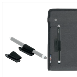
001081 Fourreau adhésif universel pour stylet ou stylo