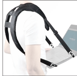
001026 Harnais ergonomique 4 points d'accroche