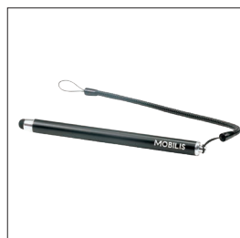
001054 - Pack de 10 Stylet capacitif et cordon spiralé