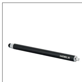
001053 Stylet capacitif à l'unité