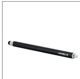
001053 Stylet capacitif à l'unité