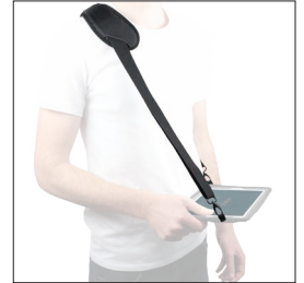
001048 Bandoillère de transport basique avec 4 soft rings 2 points d'accroche