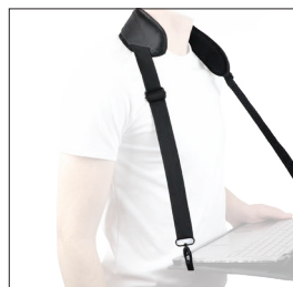
001025 Bandoillère ergonomique avec pattes cervicales 2 points d'accroche