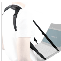
001024 Bandoillère de saisie et de transport 4 points d'accroche