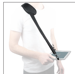
001048 Bandoillère de transport basique avec 4 soft rings 2 points d'accroche