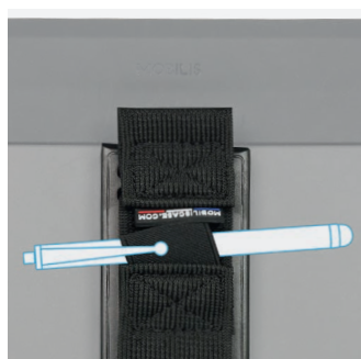
Sur la patte élastique de saisie Stylet non inclus