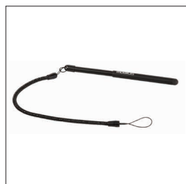
001030 - Pack de 10 Stylet rétractable capacitif et cordon spiralé