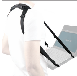
001024 Bandoillère de saisie et de transport 4 points d'accroche