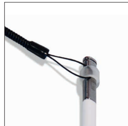
001033 - Pack de 10 Cordon spiralé + tube élastique