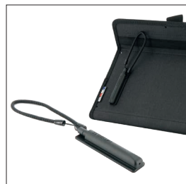
001080 - Pack de 10 Fourreau adhésif avec stylet rétractable et cordon spiralé inclus