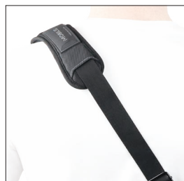
001027 Bandoillère avec système de sécurité 2 points d'accroche