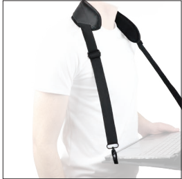
001025 Bandoillère ergonomique avec pattes cervicales 2 points d'accroche