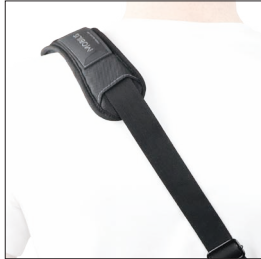
001027 Bandoillère avec système de sécurité 2 points d'accroche