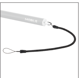
001032 - Pack de 10 Cordon spiralé