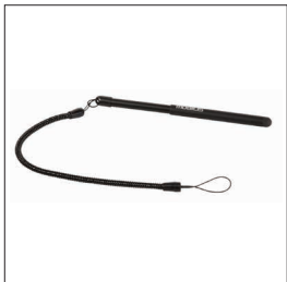
001030 - Pack de 10 Stylet rétractable capacitif et cordon spiralé