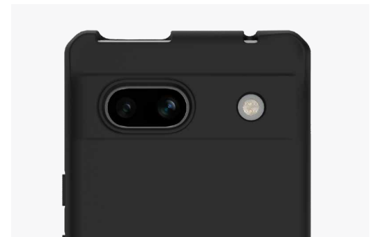
Protège votre écran et l'objectif de votre appareil photo

Notre technologie antimicrobienne ionique fonctionne au niveau cellulaire pour perturber continuellement la croissance et la reproduction des micro-organismes. Cela crée une attaque multipoints, endommageant les protéines, la membrane cellulaire, l'ADN et les systèmes internes des bactéries, et de nombreux virus courants.