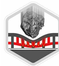
Ajout de résistance à l'impact avec la deuxième couche

Utilisant l'air comme matelas pour absorber les chocs, les micro-poches à air en nid d'abeilles ont désormais une couche supplémentaire qui permet une résistance en 2 étapes contre l'énergie cinétique générée, si vous laissez tomber votre téléphone.