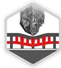
La première couche de résistance