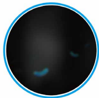
Impactthane protégé après 2 heures Jusqu'à 99% de microbes tués