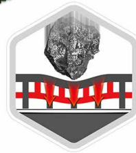
La première couche de résistance