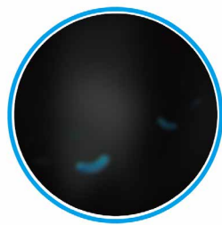
Impacthane protégé après 2 heures Jusqu'à 99% de microbes tués