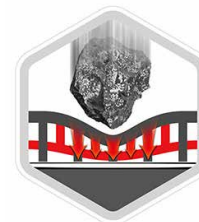
Ajout de résistance à l'impact avec la deuxième couche

Utilisant l'air comme matelas pour absorber les chocs, les micro-poches à air en nid d'abeilles ont désormais une couche supplémentaire qui permet une résistance en 2 étapes contre l'énergie cinétique générée, si vous laissez tomber votre téléphone.