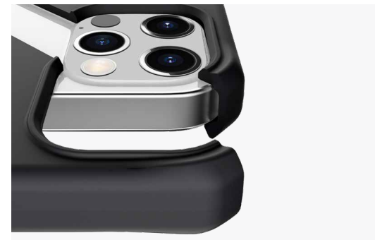
Protège votre écran et l'objectif de votre appareil photo

Notre technologie antimicrobienne ionique fonctionne au niveau cellulaire pour perturber continuellement la croissance et la reproduction des micro-organismes. Cela crée une attaque multipoints, endommageant les protéines, la membrane cellulaire, l'ADN et les systèmes internes des bactéries, et de nombreux virus courants.