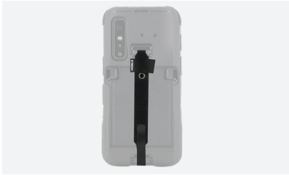
HAND STRAP Réf. 001367