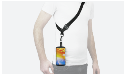
BANDOULIÈRE 1 POINT D'ACCROCHE Réf. 001084