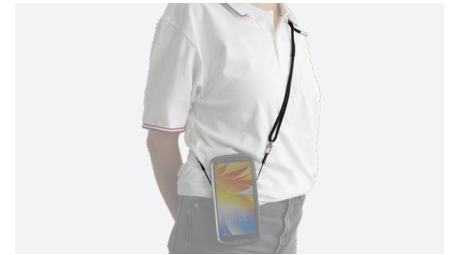
BANDOULIÈRE 2 POINTS D'ACCROCHE Réf. 001397