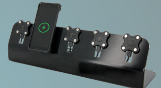
CHARGING STATION 5 SLOTS 120W ref. 020010