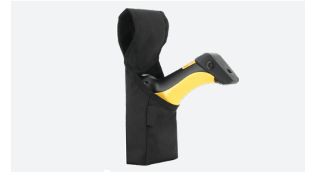
HOLSTER POS M Réf. 031022