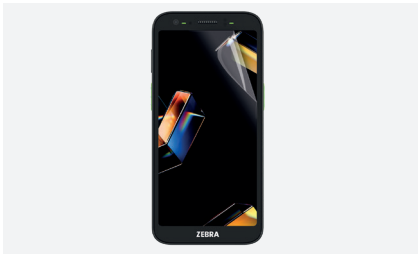
ÉCRAN DE PROTECTION Réf. 036376