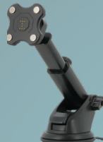
CHARGING SUCTION MOUNT 65W ref.020008