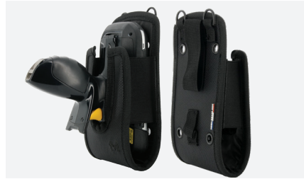
HOLSTER M Réf. 031010