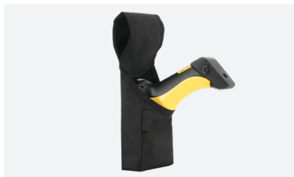
HOLSTER POS M Ref. 031022