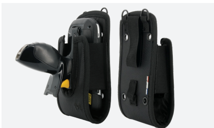
HOLSTER M Ref. 031010