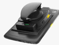
Expansion Backs 8" SKU# ZBK-ET4X-8BTRYBK1-01 10" SKU# ZBK-ET4X-10BTRYBK1-01