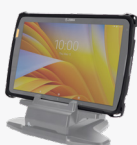
Single slot Charge-only Cradle 8" & 11" SKU# CRD-ET4X-ISC01-01