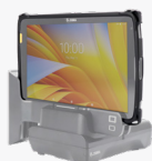
T adaptaters 8" SKU# ADP-ET4X-8T4S1-04 10" SKU# ADP-ET4X-10T4S1-04