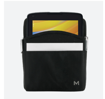
Holster for tablet - Belt & accessory pocket - Easy access system - 031013 - 031014