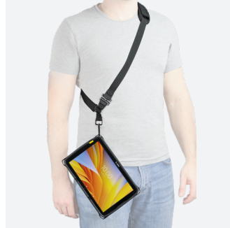
Bandoulière universelle avec système de détachement de sécurité + anneau textile - 1 point d'accroche - 001084