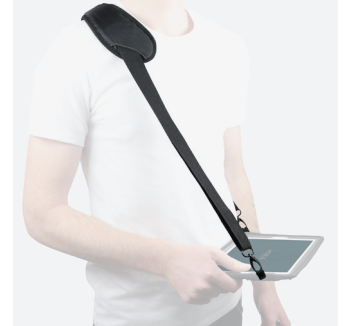
Bandoulière ergonomique avec patte épaule - cervicales - 2 points d'accroche - Saisie / Transport - 001025