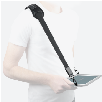
Bandoulière avec système de détachement de sécurité - 2 points d'accroche - Saisie / Transport - 001027