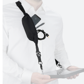
Bandoulière universelle avec système de détachement de sécurité + poche extensible - 2 points d'accroche - 001092