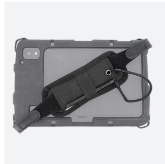
Patte de saisie universelle - Ajustable par Velcro® - Passant stylét 001095 - 001096