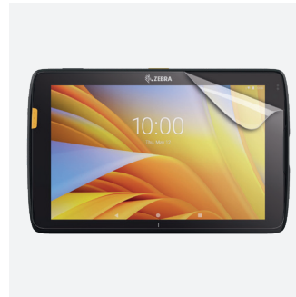
Protège-écran incassable anti-chocks IK06 finition transparente - 036276 - 036288