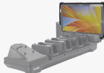
Four slot Charge only cradle 8" SKU# ADP-ET4X-8T4S1-04 10" SKU# ADP-ET4X-10T4S1-04