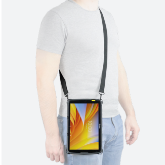
Bandoulière basique avec 2 soft O rings - 2 points d'accroche - 001093