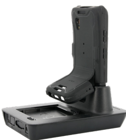
Station d'accueil Compatible accessoires de charges - :