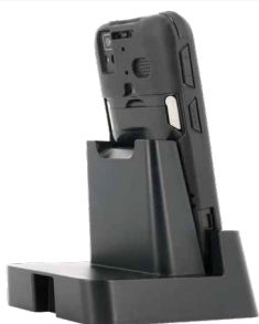
Station d'accueil Compatible accessoires de charges Datalogic : Puit 1, 3 ou 4 emplacements