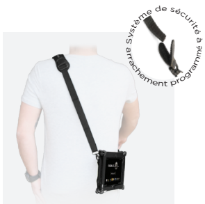
Bandoulière de transport à arrachement programmé 2 points d'accroche