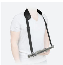
Bandoulière Ergo - 2 points d'accroche. Idéal transport et saisie occasionnelle