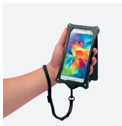
Pack de 10 dragonettes