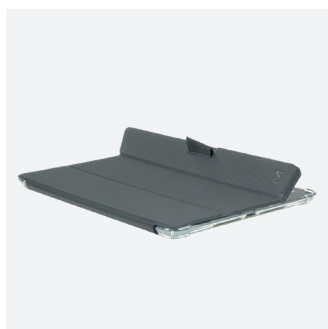
Mise en veille et réveil automatique