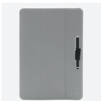
Stylet non inclus