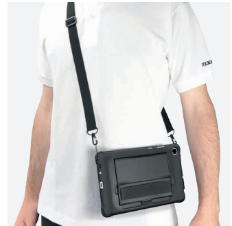
Pour le transport