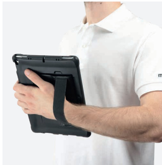
Mode portrait / Mode paysage