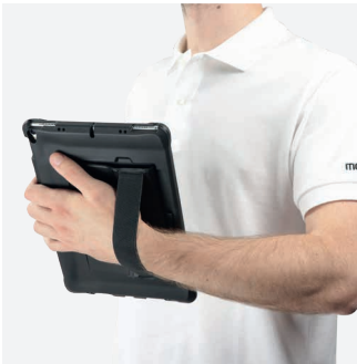
Mode portrait / Mode paysage