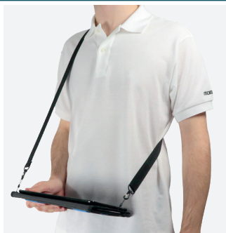
Pour la saisie en position debout