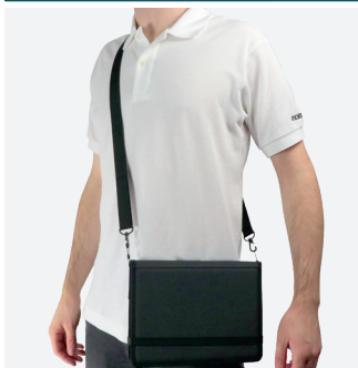
Pour le transport