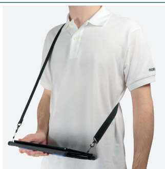
Pour la saisie en position debout