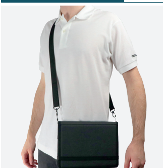
Pour le transport