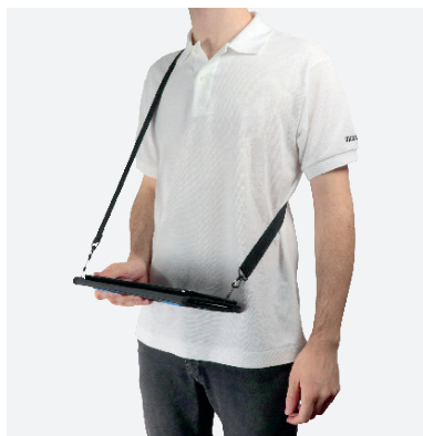
Pour la saisie en position debout