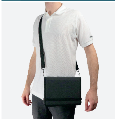
Pour le transport