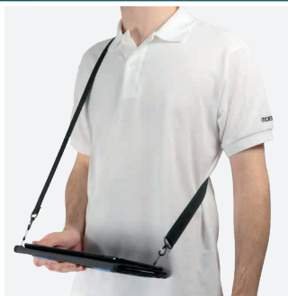
Pour la saisie en position debout