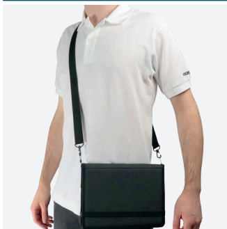
Pour le transport