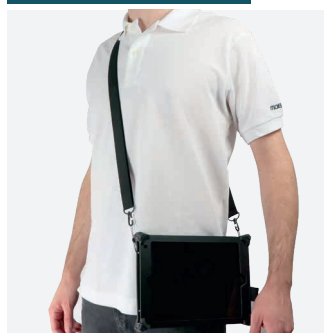
Pour le transport