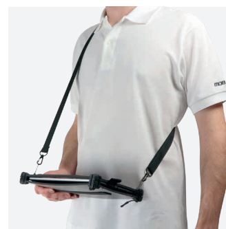
Pour la saisie en position debout