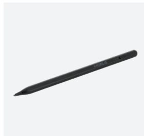
STYLET BLUETOOTH Ref. 001090