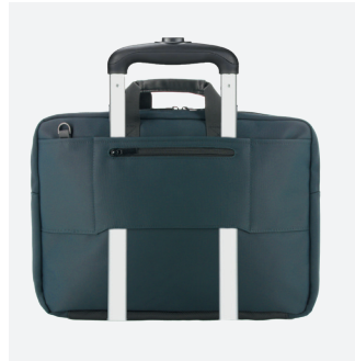
Avec poche intégrée