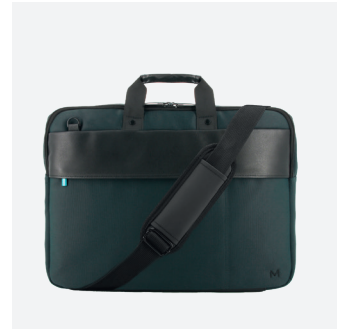
Bandoulière réglable et amovible