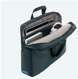
Pour PC jusqu'à 16"