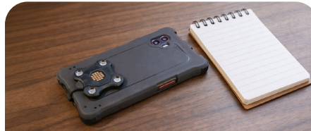
Energia Mobile - Magnetic Pogo Pin Dongle Short cable 30mm