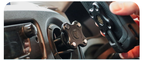
Energia Mobile + Charging Airvent Mount 65W