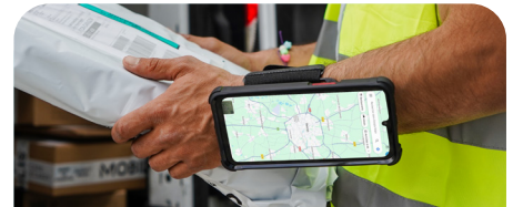
Magnetic Armband - Compatible Energia Mobile