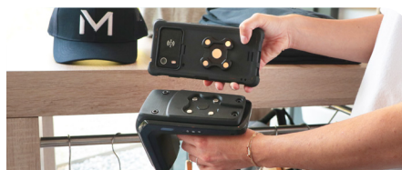
Energia Mobile - Zebra RFD40 Sled Bluetooth Adapter