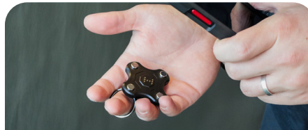
Charging Tripod & Ring 65W - Compatible Energia Mobile