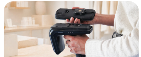
Energia Mobile - Universal Adapter Height Booster