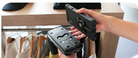
Energia Mobile - Zebra RFD40 Sled Smart Pin Adapter