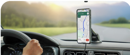
Energia Mobile + Charging Suction Mount 65W