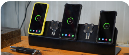
Energia Dock - Charging station 5 slots 120W - Plug

EU plug ref: 020010 UK plug ref: 020011 US plug ref : 020021