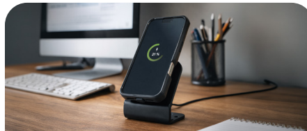
Energia Dock - Charging station 1 slot 65W - Plug