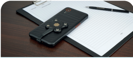
Energia Mobile - Magnetic Pogo Pin Dongle

✦ CONSERVEZ LA COMPATIBILITÉ AVEC LE DONGLE POGO PIN ENERGIA MOBILE GRÂCE À NOTRE HAND STRAP ET PROFITEZ DE NOTRE LARGE CHOIX DE SUPPORTS GRÂCE AU SYSTÈME MAGNÉTIQUE INTÉGRÉ À L'ARRIÈRE.