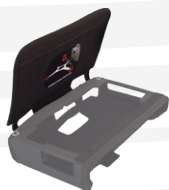
Solapa de protección de pantalla