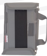
Goma de agarre